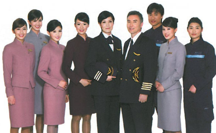
華航歡迎擁有熱情的青年男女，加入充滿夢想的航空業。

A：培訓機師訓練為期約 2 年（送國外飛行學校及返國後民航駕駛員訓練各約 1 年），完訓後以試用副機師任用。從副機師升格至正機師約需 7 年時間。